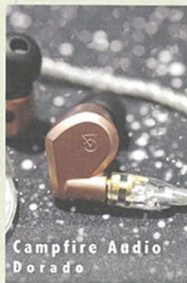
Campfire Audio Dorado