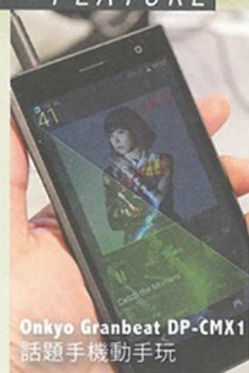
Onkyo Granbeat DP-CMX1 話題手機動手玩